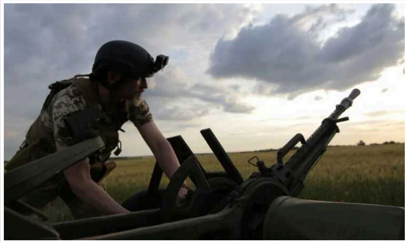
ISW: Мобільні групи Збройних Сил України на 25 км просунулися в Біловському районі Курської області

За словами американських аналітиків, ряд російських провояєнних блогерів стверджували, що Сили оборони зі значною кількістю бронетехніки перетнули кордон із Сумською областю в районі Кучерівки та Гоптарівки і швидко просунулися до Білої.