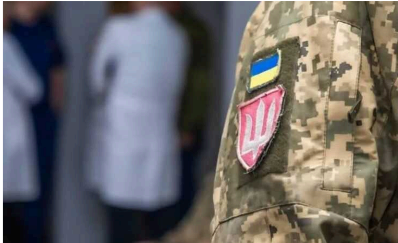
У додатку "Резерв+" може з'явитися електронне направлення на ВЛК

Електронне направлення міститиме QR-код, за ним лікарі ідентифікуватимуть військовозобов'язаного чоловіка, розповіла заступниця міністра оборони Катерина Черногоренко.