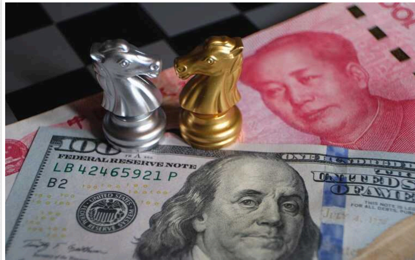
Іноземні інвестори вивели з Китаю рекордну суму грошей, – Bloomberg

Закордонні фірми вивели рекордні $15 млрд з Китаю у другому кварталі 2024 року.