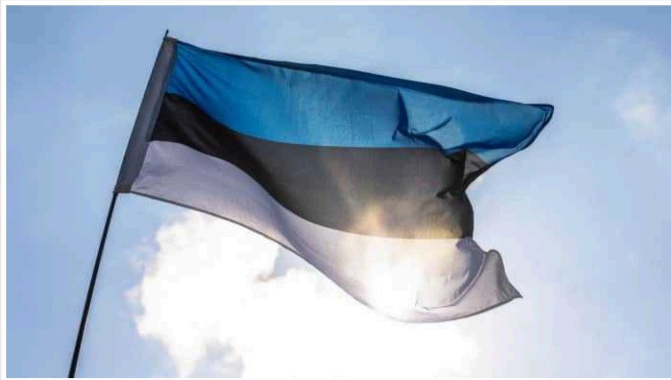
Естонія з 2026 року збільшить витрати на оборону до, близько, 4% від ВВП

Міністр оборони Естонії Ханно Певкур повідомив, що військові витрати балтійської держави зростуть до, близько, 4% від ВВП з 2026 року.