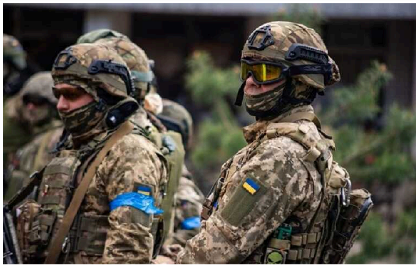
«Прорив» кордону у Курській області: інсайдер назвав кількість бійців ЗСУ, які пішли у наступ

Джерело інформаційного агентства зазначає, що операція "Курськ" підняла бойовий дух українців та ЗСУ, проте сумнівається, що вона вплине на події на сході України, де окупанти продовжують свій наступ.