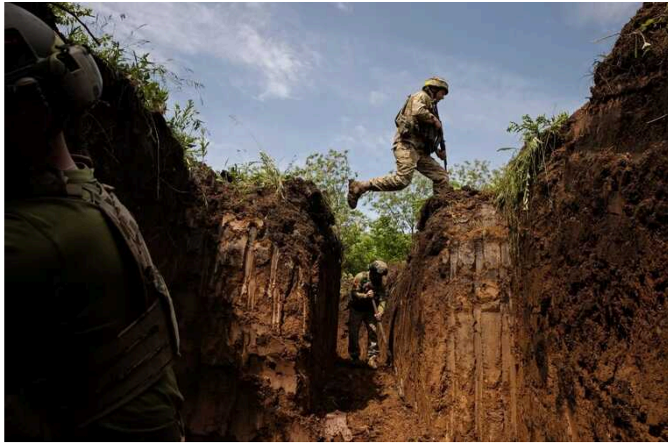
ISW: Україна просувається у Курській області, попри заяви Росії про стабілізацію ситуації

Кадри з геолокацією, а також російські та українські репортажі від 10 і 11 серпня свідчать про те, що українські сили просунулися на захід і північний захід у Курській області, хоча російські джерела в основному стверджували, що військові РФ стабілізували ситуацію.