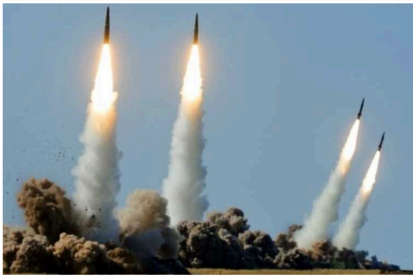
Українська влада готується до потужного ракетного удару з боку Росії після вторгнення в Курську область

Це можуть бути удари по ряду об'єктів Києва, включаючи парламент та інші урядові будівлі.