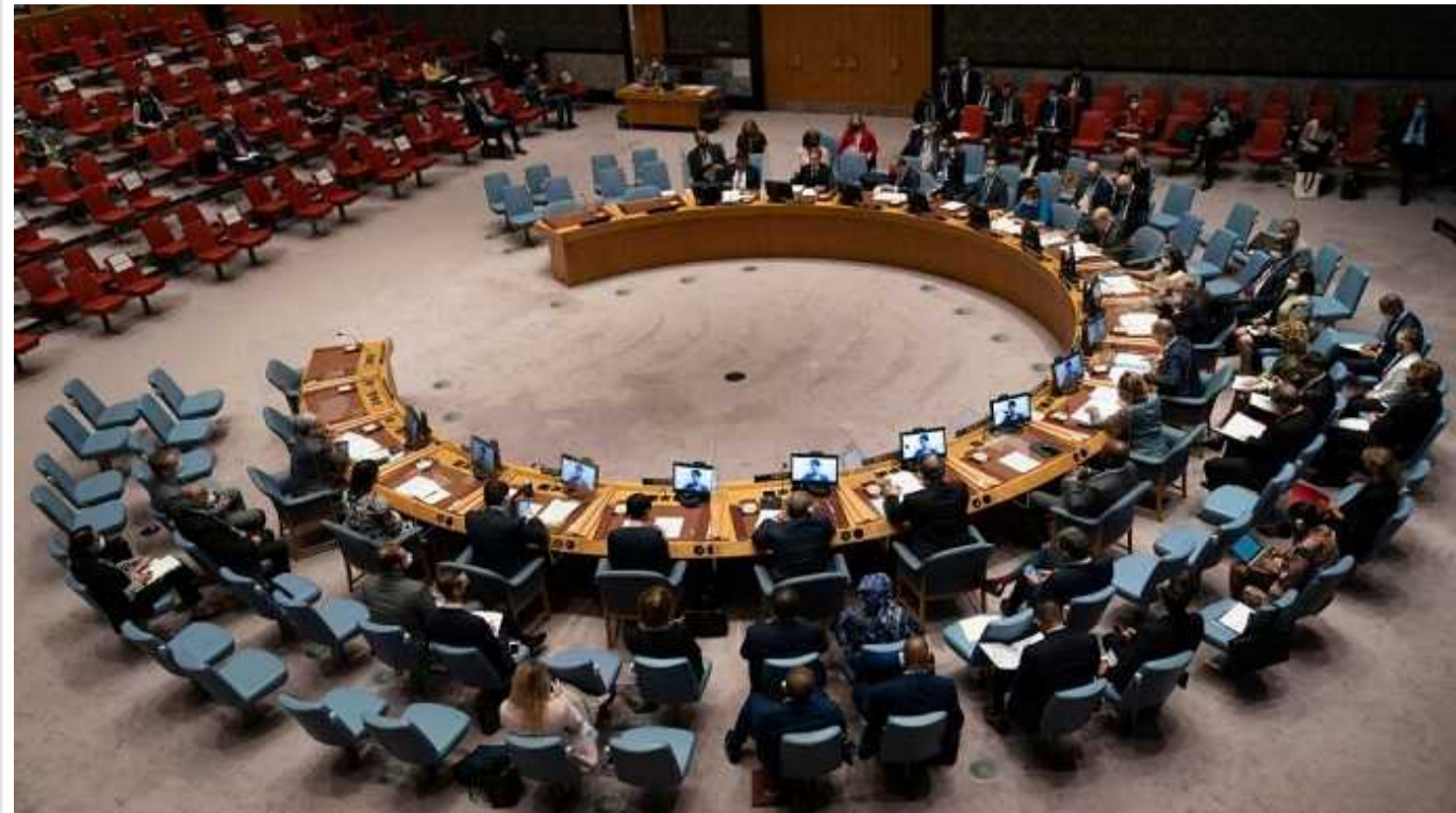
Росія скликає неформальну зустріч Радбезу ООН, щоб поскаржитися на наступ ЗСУ в Курській області

Росія скликає неформальну зустріч членів Радбезу ООН, щоб поскаржитися на атаку українських сил в Курській області.