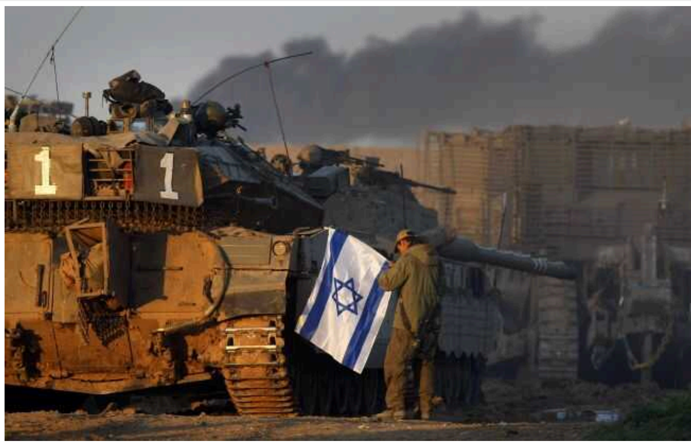
В Ізраїлі вважають, що Іран вирішив його атакувати, - Axios

Ізраїльська розвідка вважає, що Іран вирішив на них напасти. Імовірно, це може відбутись протягом кількох днів.