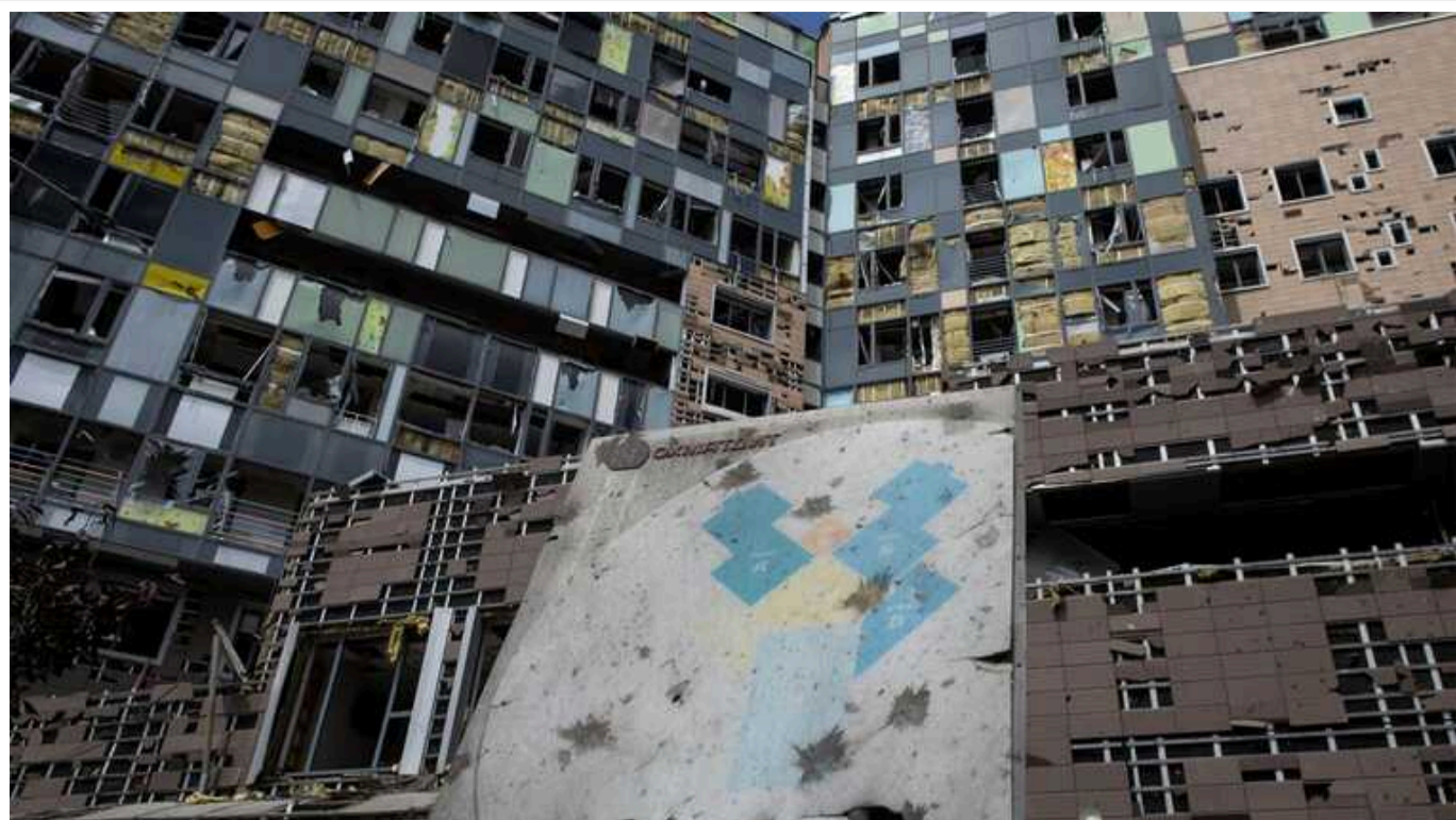
МОЗ затвердило перших учасників ради з відновлення «Охматдиту»

Міністерство охорони здоров'я затвердило перших вісім учасників Ради з контролю здійснення відновлення зруйнованих будівель Національної дитячої спеціалізованої лікарні «Охматдит».