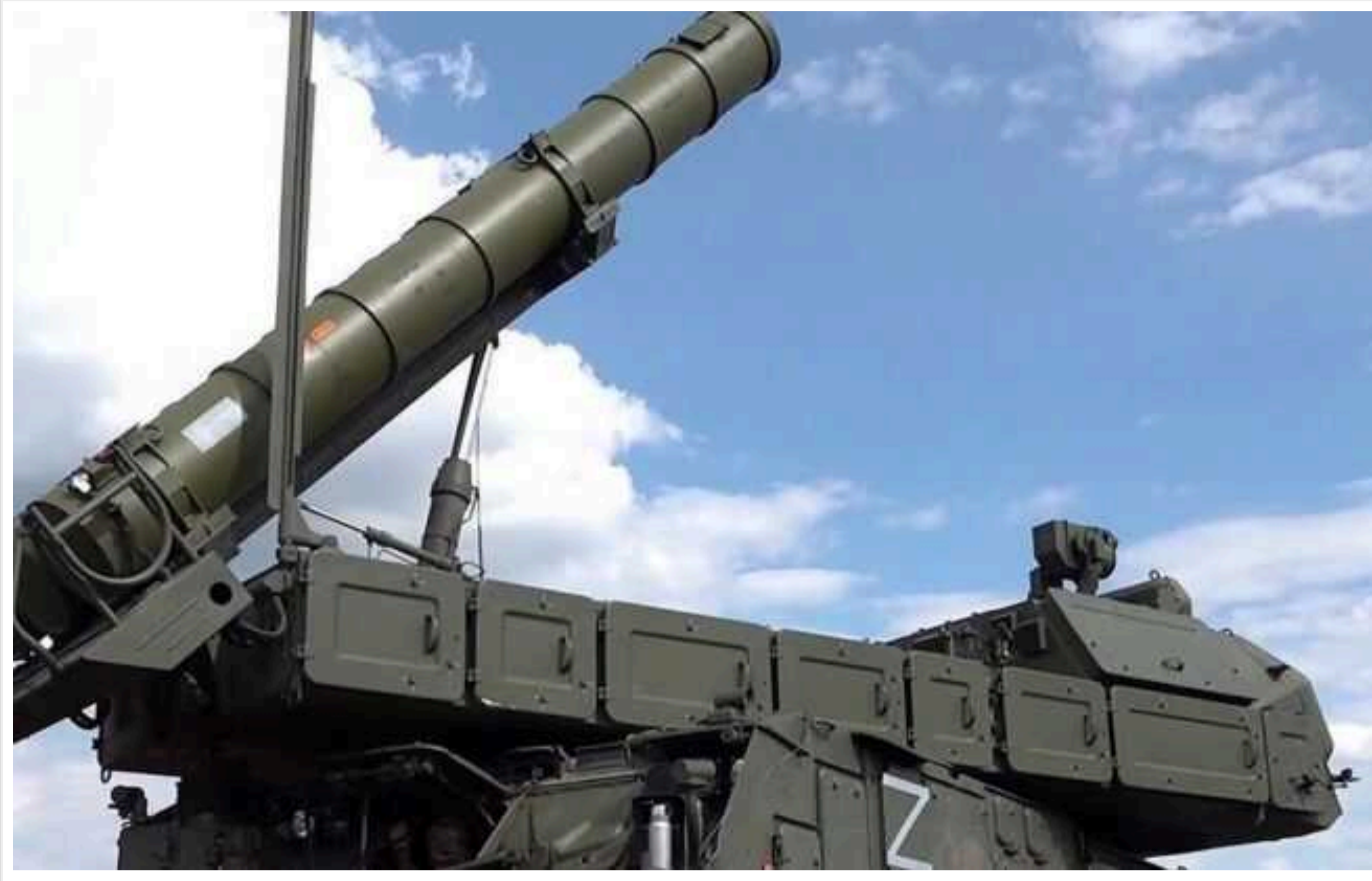
У РФ в Міноборони звітують про «відбиття» цієї ночі атаки БПЛА у двох областях

У Росії заявили про роботу сил та засобів протиповітряної оборони через атаки із застосуванням безпілотників у двох регіонах цієї ночі. Йдеться про Курську та Ярославську області.