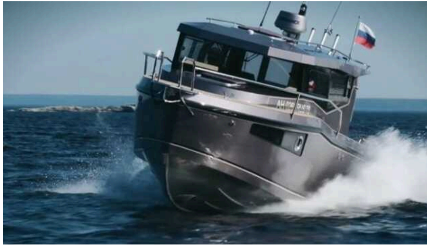
Українські розвідники в окупованому Криму знищили ще один катер РФ

У ніч на 9 серпня поблизу населеного пункту Чорноморське у Криму війни спецпідрозділу Головного управління розвідки Міністерства оборони України Group 13 за допомогою ударного морського дрона MAGURA V5 знищили швидкісний катер проєкту КС 701 типу "Тунец".