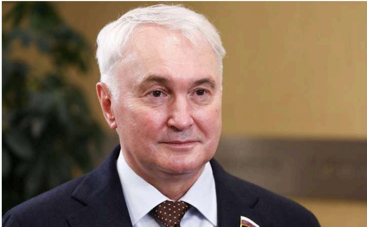
Андрій Картаполов

У Державній думі РФ заявили, що в рамках оголошеного наміру бити по "центрах ухвалення рішень" під атаки не потраплять Офіс Президента Володимира Зеленського та будівля Верховної Ради у центрі Києва. Про це повідомив голова комітету Держдуми з оборони Андрій Картаполов.