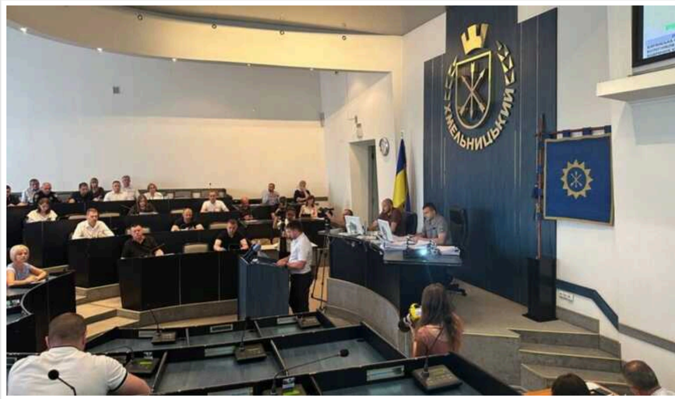
Хмельницька мерія засекретила ціни на будматеріали для будівництва житла за гранти

Управління капітального будівництва Хмельницької міської ради 26 липня уклало дві угоди з ТОВ «Новітні енергетичні програми» про будівництво трьох багатоквартирних житлових будинків для внутрішньо переміщених осіб за 8,39 млн євро без ПДВ та протирадіаційного укриття в одному з них за 9,66 млн грн із ПДВ.