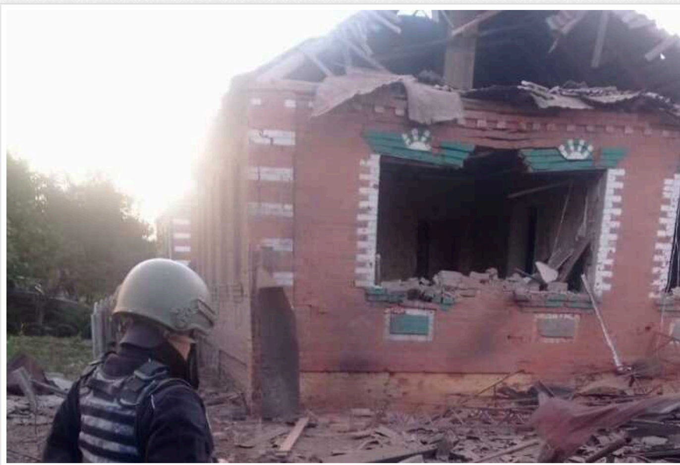
Окупанти 4 рази за ніч обстріляли населені пункти Харківщини, є поранені

Російська армія вночі 9 серпня чотири рази обстріляла населені пункти Харківської області, є поранені.