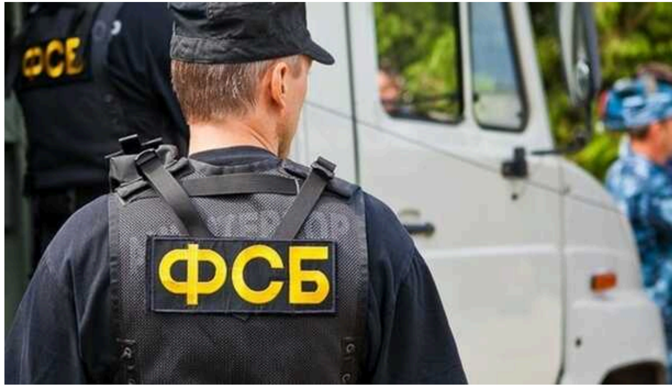
Російські спецслужби активізували кол-центри для поширення фейків та вербування українців - ЦПД

Росіяни активізували кол-центри для поширення дезінформації та спроб вербування українців для здійснення підпалів автомобілів військовослужбовців за завданням спецслужб РФ.