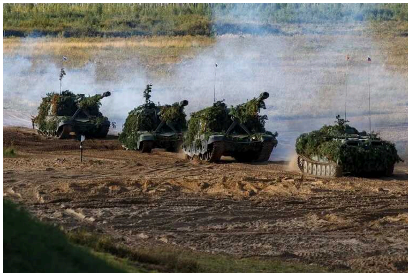
Діями в Курській області РФ ЗСУ змогли досягти оперативної несподіванки, - ISW

Аналітики Інституту вивчення війни припускають, що відсутність узгодженої реакції Росії на українське вторгнення в Курську область і швидкість просування свідчать про те, що українські війська змогли досягти оперативної несподіванки.