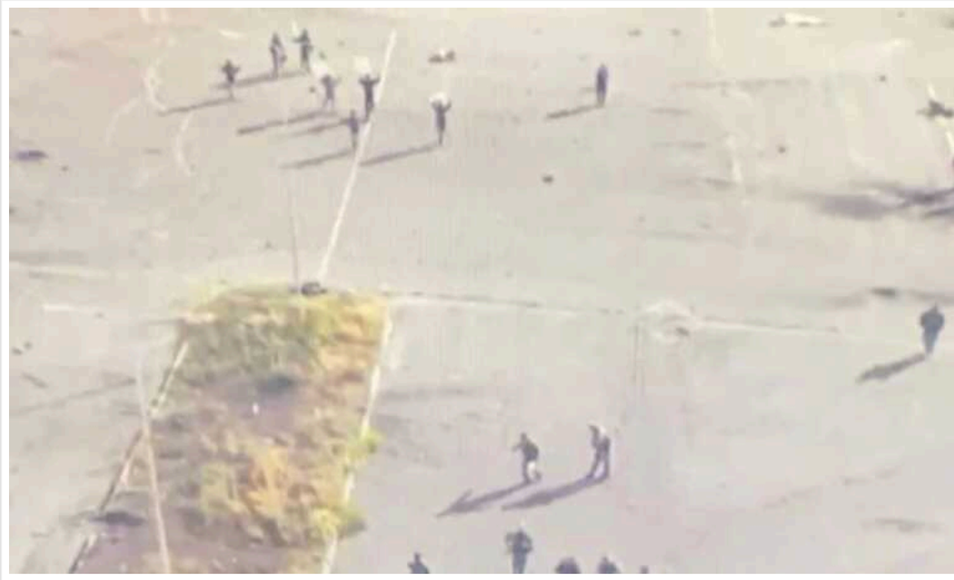
У Росії не розуміють, як подавати інформацію про те, що відбувається в Курській області

Події в Курській області не вдається списати на випадкові збіги обставин або жест доброї волі, зазначає військовий оглядач Ігаль Левін.