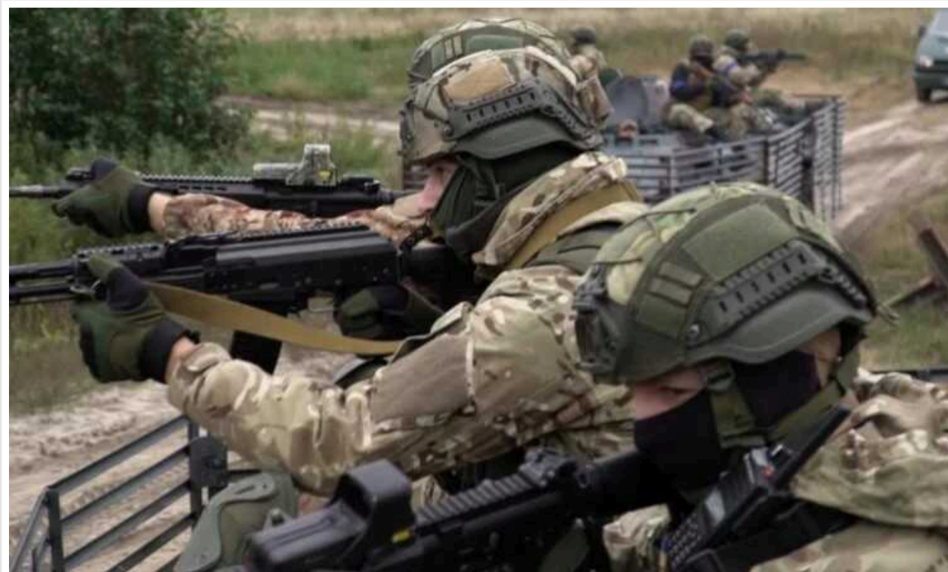
У Міноборони Франції розповіли про успіхи ЗСУ в Курській області

У відомстві заявили, що Сили оборони України скористалися ефектом несподіванки. Крім того, російські сили там виявилися менш підготовленими, ніж на Донбасі та Харківській області.