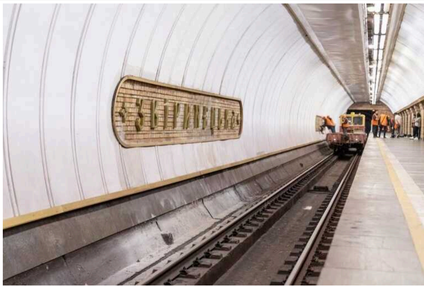
КП «Київський метрополітен» замовило польські рейки на 17% дорожче в доларах, ніж китайські в січні

КП «Київський метрополітен» 31 липня за результатами тендерів замовило ТОВ «Сота Україна» різних рейок на 86,43 млн грн.