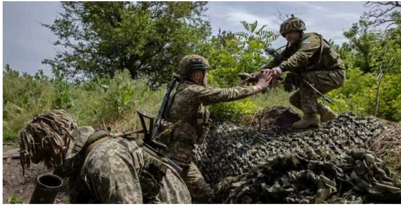
Ситуація на фронті: ЗС РФ намагаються просунутись біля Часового Яру та штурмують Покровський напрямок

Минулої доби російські війська зосереджували свої атаки біля Часового Яру на Краматорському напрямку та штурмували Покровський напрямок біля 10 населених пунктів, за добу відбулося 96 бойових зіткнень.