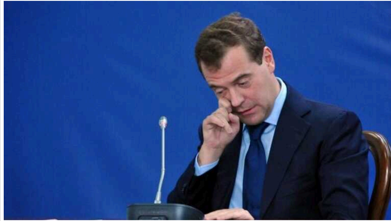
«Прорив» в Курську область: Медведєв влаштував істерику та закликав змінити статус «СВО»

Експрезидент РФ позарився на Одесу, Київ і Миколаїв та заявив, що відтепер можна "без реверансів" говорити про повне захоплення України. Також соратник Путіна назвав нашу країну "Українським рейхом".