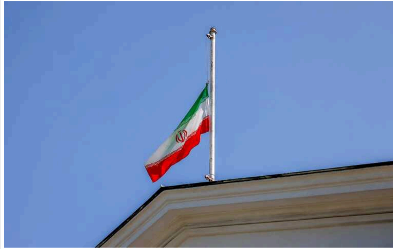
Иран закликав Єгипет уникати його повітряного простору протягом 3 годин у четвер, – AP

Міністерство цивільної авіації Єгипту наказало єгипетським авіакомпаніям уникати іранського повітряного простору протягом трьох годин четверга після відповідного звернення від Тегерана. В Ірані пояснюють своє прохання проведенням військових навчань.