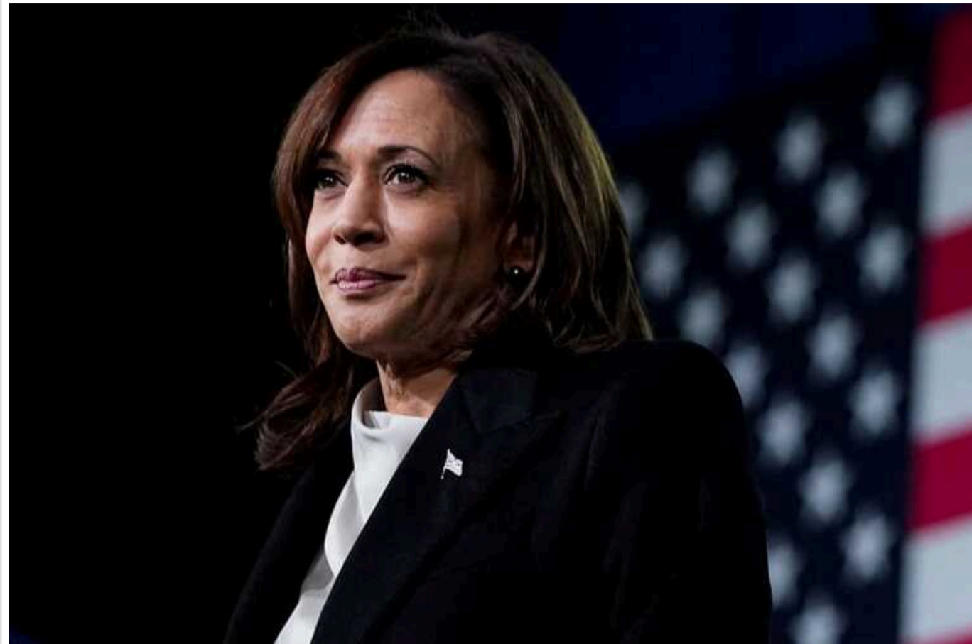
За добу після обрання кандидата у віцепрезиденти кампанія Гарріс зібрала 36 мільйонів доларів

Президентська кампанія Камали Гарріс зібрала 36 мільйонів доларів за 24 години після того, як губернатор Міннесоти Тім Волц був оголошений кандидатом у віцепрезиденти.