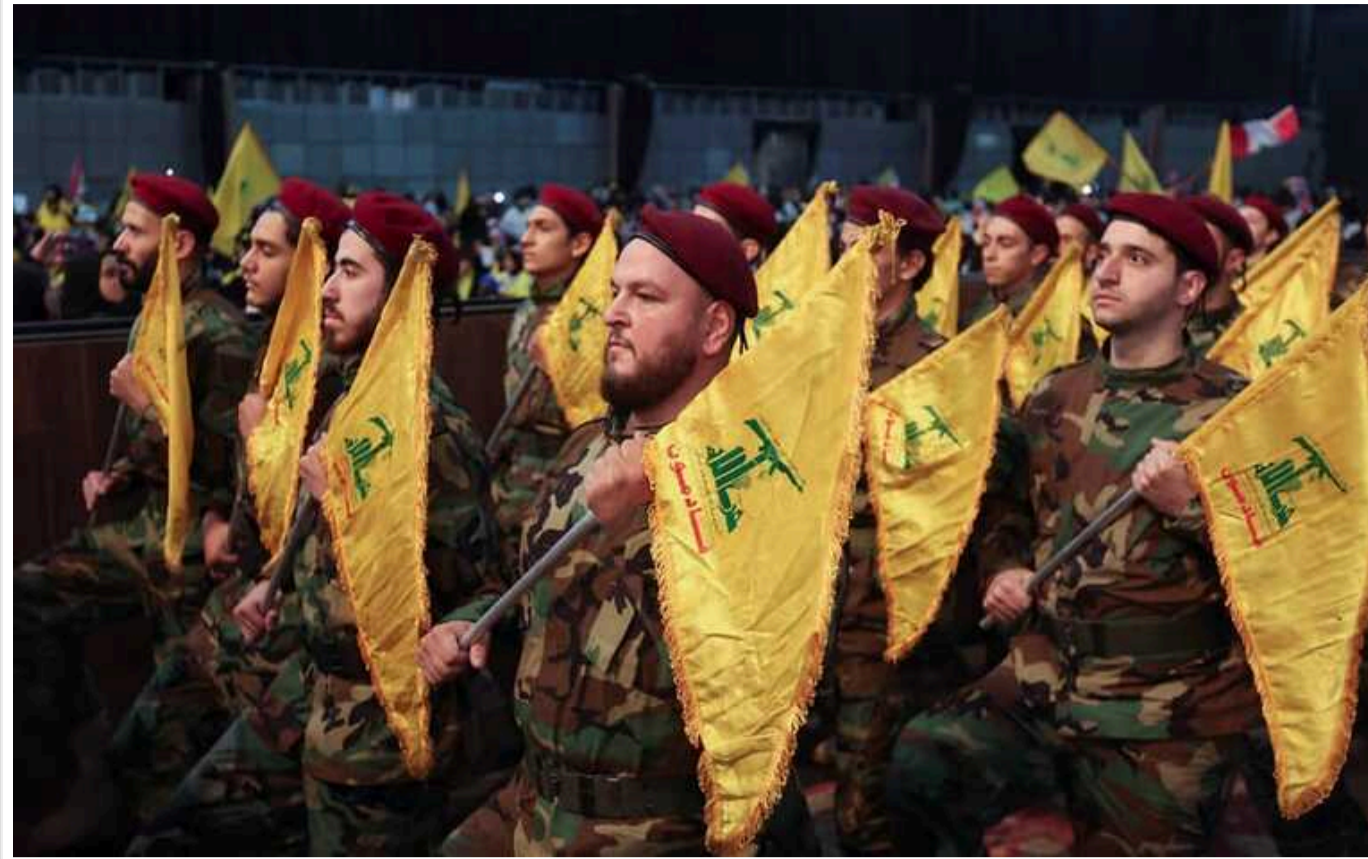
CNN: «Хезболла» готова завдати удару по Ізраїлю незалежно від Ірану

Угрупування "Хезболла" може завдати удару по Ізраїлю незалежно від намірів Ірану. Атака можлива вже найближчими днями.