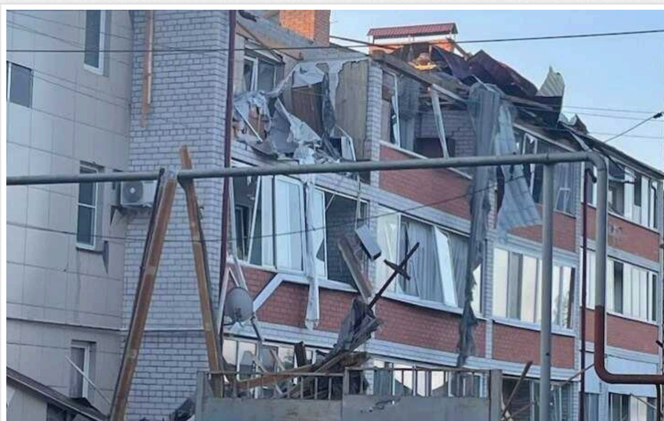
Українські війська просунулися на 10 км у Курську область і захопили 11 населених пунктів, – ISW

Упродовж середи, 7 серпня, українські війська просунулися на відстань до 10 кілометрів углиб Курської області Росії. Бронетехніка Сил оборони вийшла на позиції вздовж траси 38К-030 Суджа – Коренево.