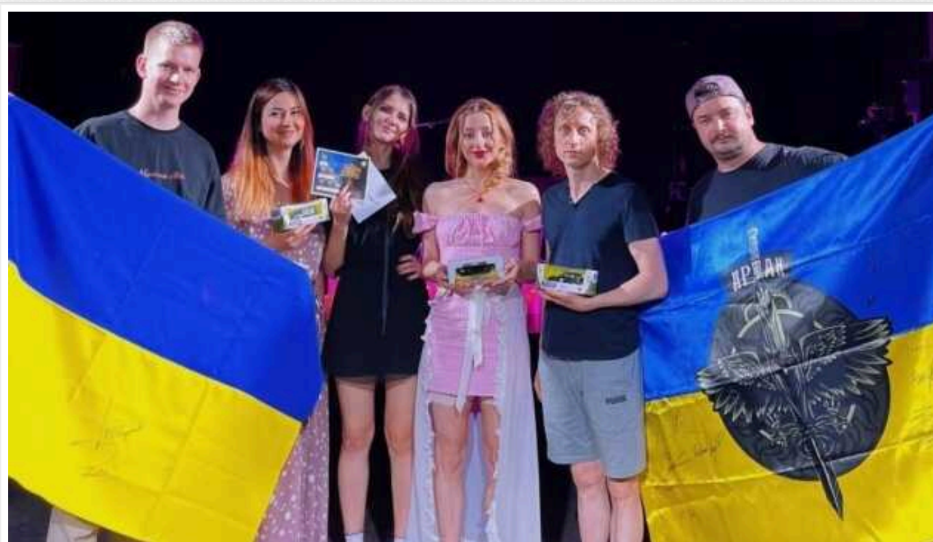
Гурт Vivienne Mort зібрав в Європі на дрони 1,5 мільйона гривень

Український гурт Vivienne Mort у межах благодійного туру Європою зібрав для розвідників понад 1,5 млн гривень на закупівлю ударних морських дронів Magura V5.