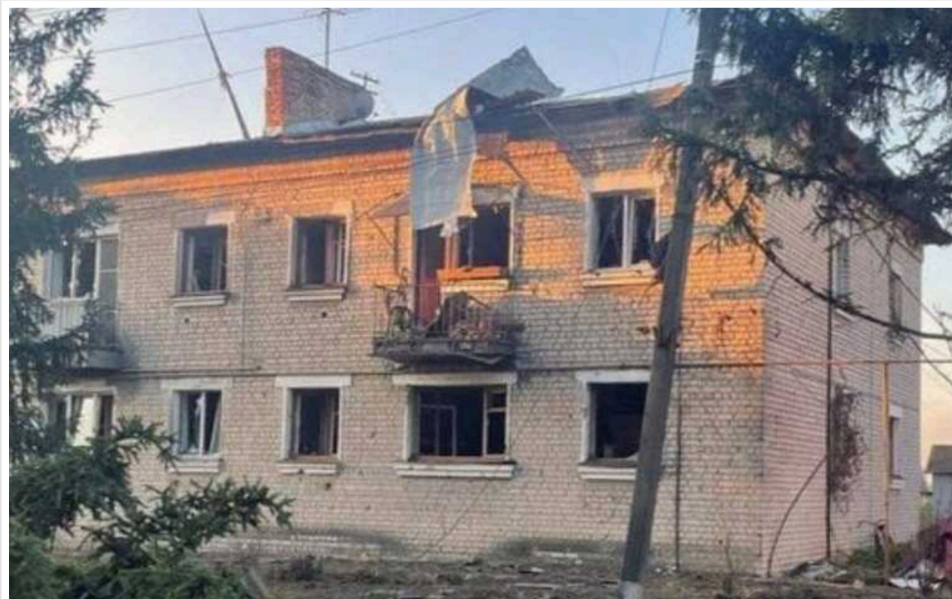
Україна заздалегідь не поінформувала США про свій план наступу на територію Росії, – The Wall Street Journal