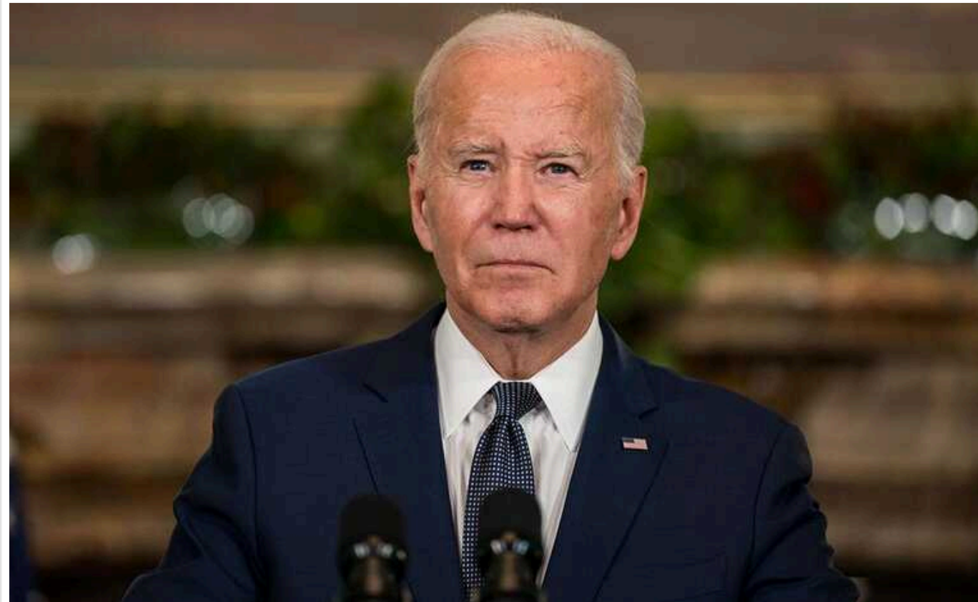
Якщо Трамп програє, то передача влади у США не пройде мирно, – Байден

Президент США Джо Байден заявив, що не впевнений у мирній передачі влади у разі поразки Дональда Трампа на президентських виборах 2024 року.