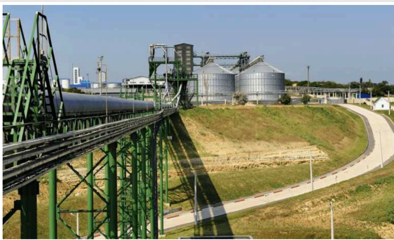
Боголюбов намагається вивести з-під застави "ПриватБанку" зерновий порт "Боріваж" і "кинути" банк на 5 мільярдів гривень, – ЗМІ

Геннадій Боголюбов намагається "провернути" шахрайську схему, за якою хоче вивести з-під застави "ПриватБанку" зерновий порт "Боріваж".