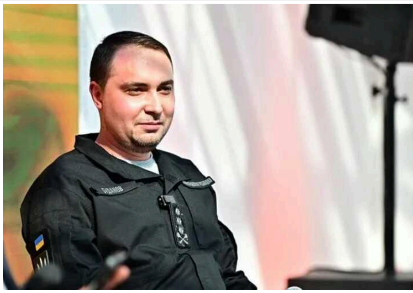
Буданов розповів, як можна вийти на кордони 1991 року

Керівник Головного управління розвідки Міноборони Кирило Буданов вважає, що перемогою України у війні з Росією буде повне відновлення територіальної цілісності нашої країни, тобто вихід на кордони 1991 року. На його думку, досягти цього можна буде комбінованим шляхом: військовою силою, дипломатією та іншими факторами.