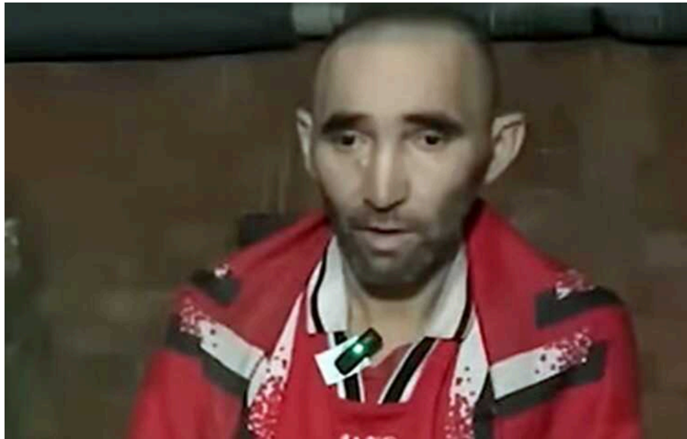
Полонений окупант розповів про злочини, скоєні в Авдіївці

Холоднокровний вбивця підписав контракт у Ханті-Мансійському окрузі, що майже за 3 тисячі кілометрів від України.