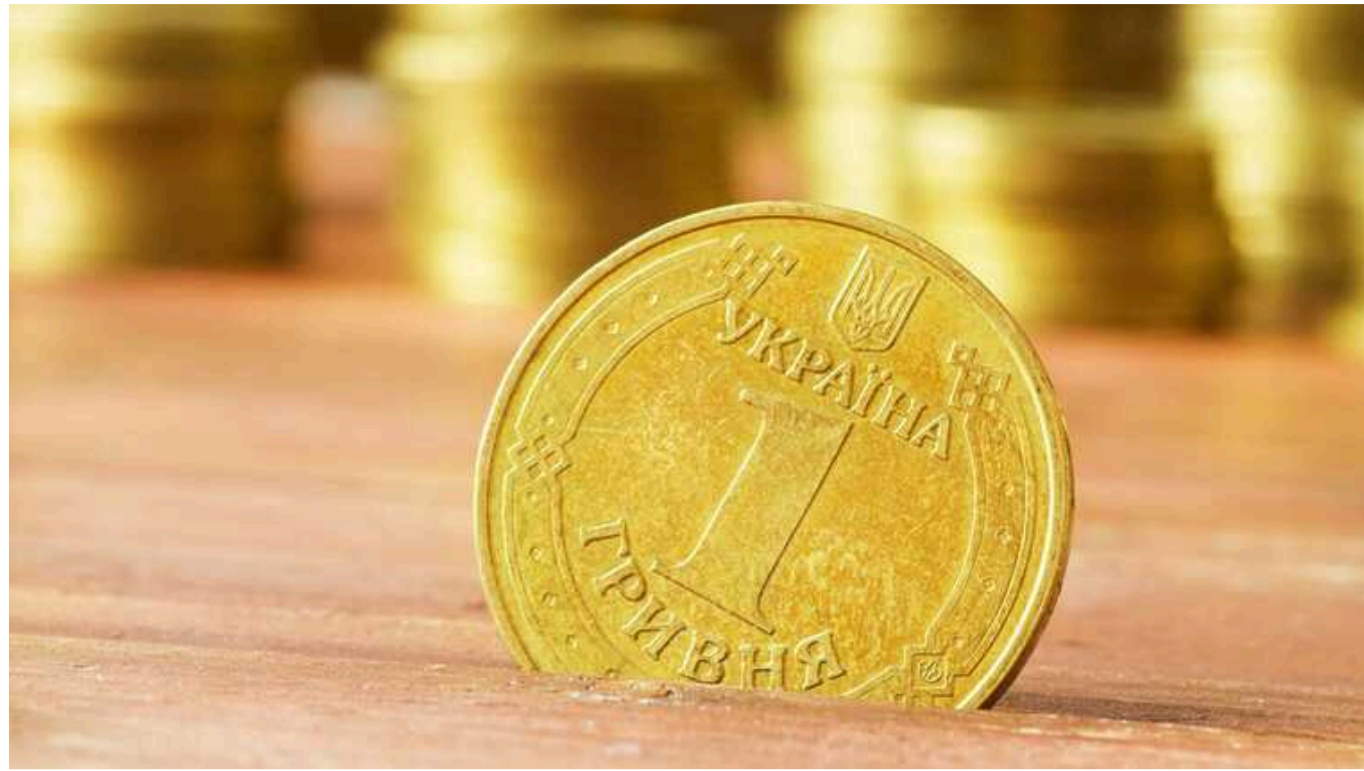
Європа блокує платежі українському бізнесу із Запоріжжя, Херсона та Донбасу

Нацбанк заявив про блокування в Європі платежів українських компаній із фронтových областей – Запорізької, Херсонської, Донецької та Луганської (з відповідною реєстрацією). Іноземні банки не розуміються, де саме знаходиться наш бізнес - на захоплених РФ територіях або на підконтрольних Україні, - і загортає платежі експортерів/імпортерів без розбору. Офіційну причину таких дій підприємствам ніхто не пояснює, але її називає НБУ через те, що компанії провалили фінансовий моніторинг у Євросоюзі.