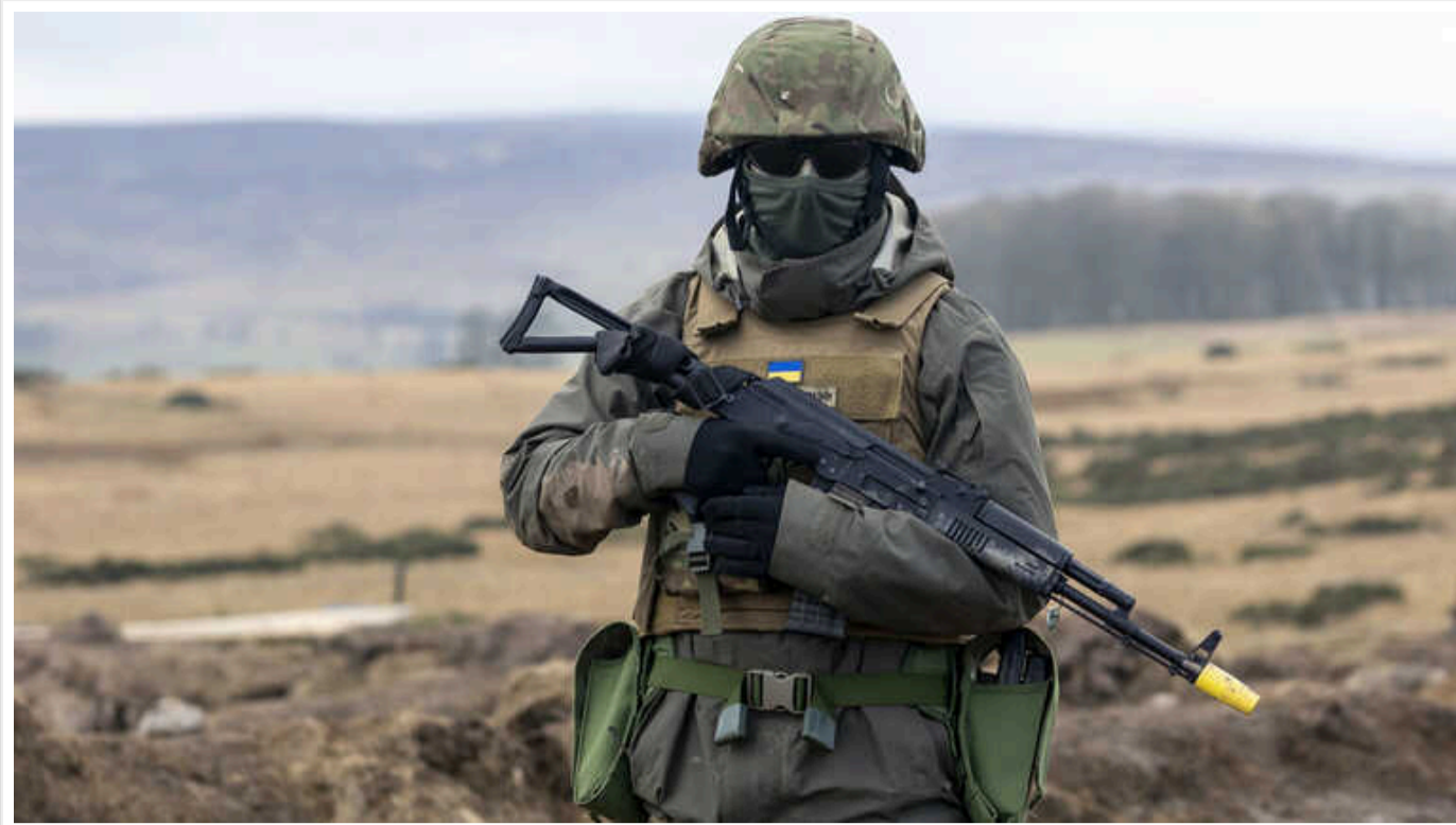
За 2 дні боїв у Курській області наші військові взяли близько 300 полонених, – військовий ЗСУ

"За 2 дні активних бойових дій на території Курської народної республіки силами контингентом невстановлених збройних формувань по підтвердженим даним було взято близько 300 полонених підарів, сподіваюсь вони передадуть їх нам."