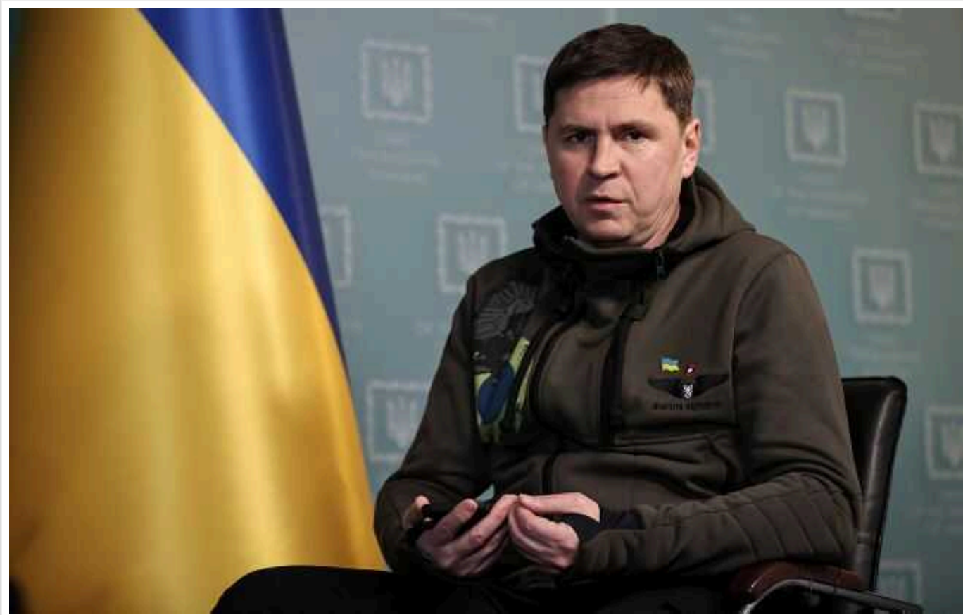
В ОП уперше відреагували на події в Курській області

Події в Курській області дають змогу побачити те, як прості росіяни ставляться до нинішньої влади у РФ. А саме те, що росіяни мають міцний свідомий взаємозв'язок із владою.