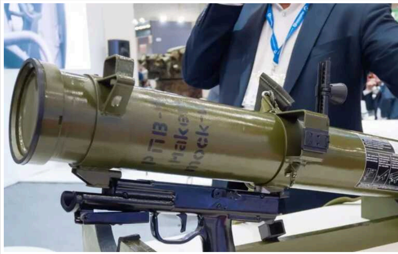
На озброєнні ЗСУ з'явиться піхотний реактивний вогнемет державного виробництва

Українське оборонне відомство кодифікувало та допустило до використання новий піхотний реактивний вогнемет вітчизняного виробництва. Нову зброю було розроблено фахівцями однієї з установ сектору ОПК.