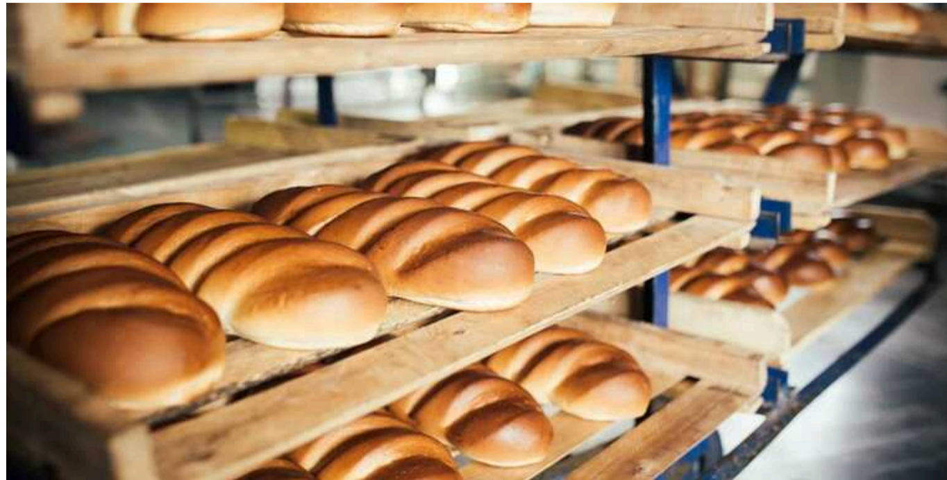
Багато хлібозаводів в Україні перебувають на межі зупинки; дехто вже переходить на роботу в одну зміну

Тому існують великі ризики перебоїв із постачанням хліба до магазинів, особливо у регіонах.