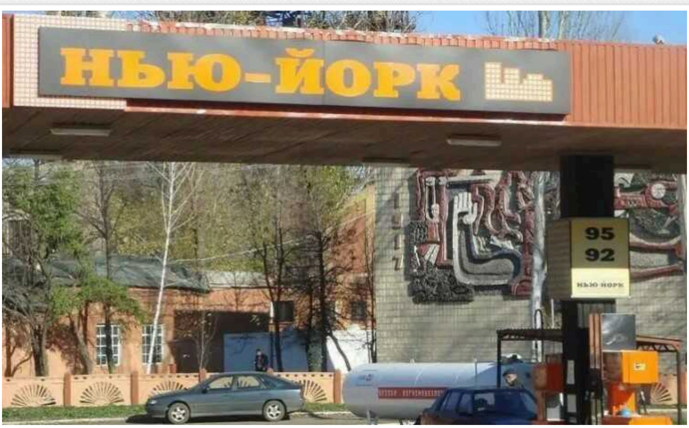
Як захистити Торецьк, якщо РФ захопить селище Нью-Йорк

Бої за Нью-Йорк – важливий медійний компонент просування військ Росії в Донецькій області. Якщо селище впаде, окупанти підійдуть до Торецька з півдня.