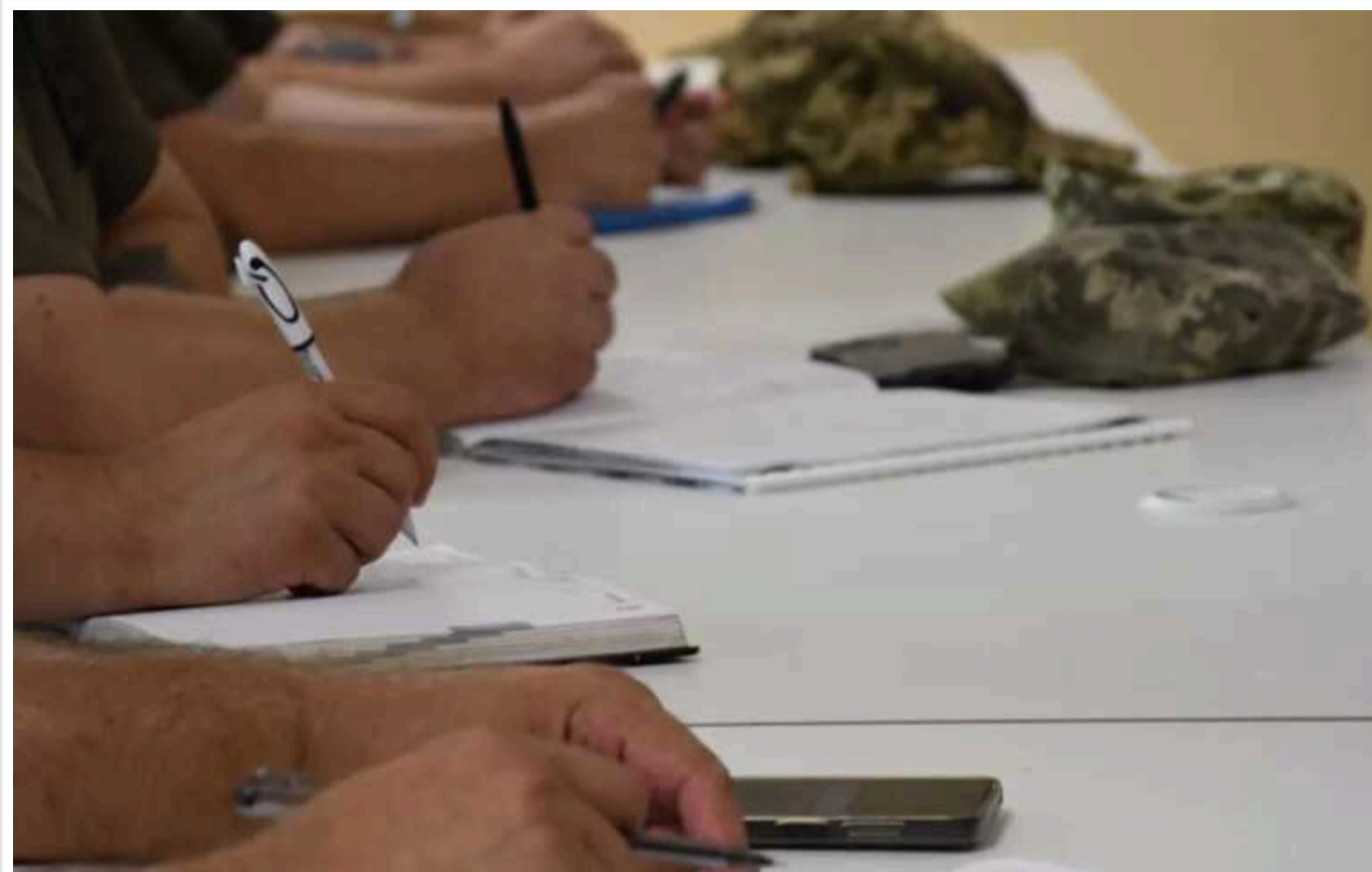
Багато військовозобов'язаних, які мають право на відстрочку та подали документи до ТЦК, отримали право на неї лише до 12 серпня

Про це повідомляє «Судово-юридична газета».