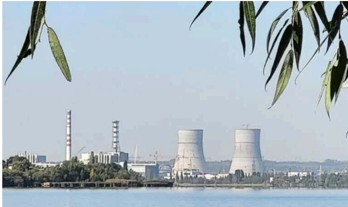
На Курській АЕС підготували "Панцирі" та поставили на охорону жінок, – ЗМІ

Керівництво станції не має жодного плану на випадок приходу українських військ, а співробітники хвилюються через відсутність укриттів.