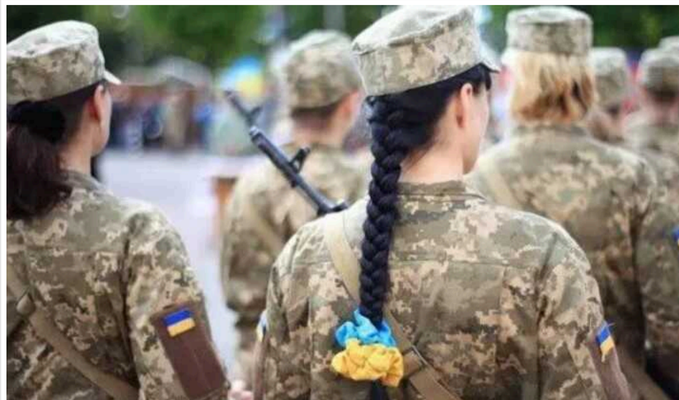
18 жінок, які відбували покарання за скоєні злочини та добровільно вступили до лав ЗСУ, вже беруть участь у бойових діях, — ЗМІ

До Збройних сил України вже долучилися 18 раніше засуджених жінок. Ті, хто висловив бажання мобілізуватися, отримали амністію та вже беруть участь у бойових діях, повідомили в Головному управлінні комунікацій ЗСУ в середу, 7 серпня.