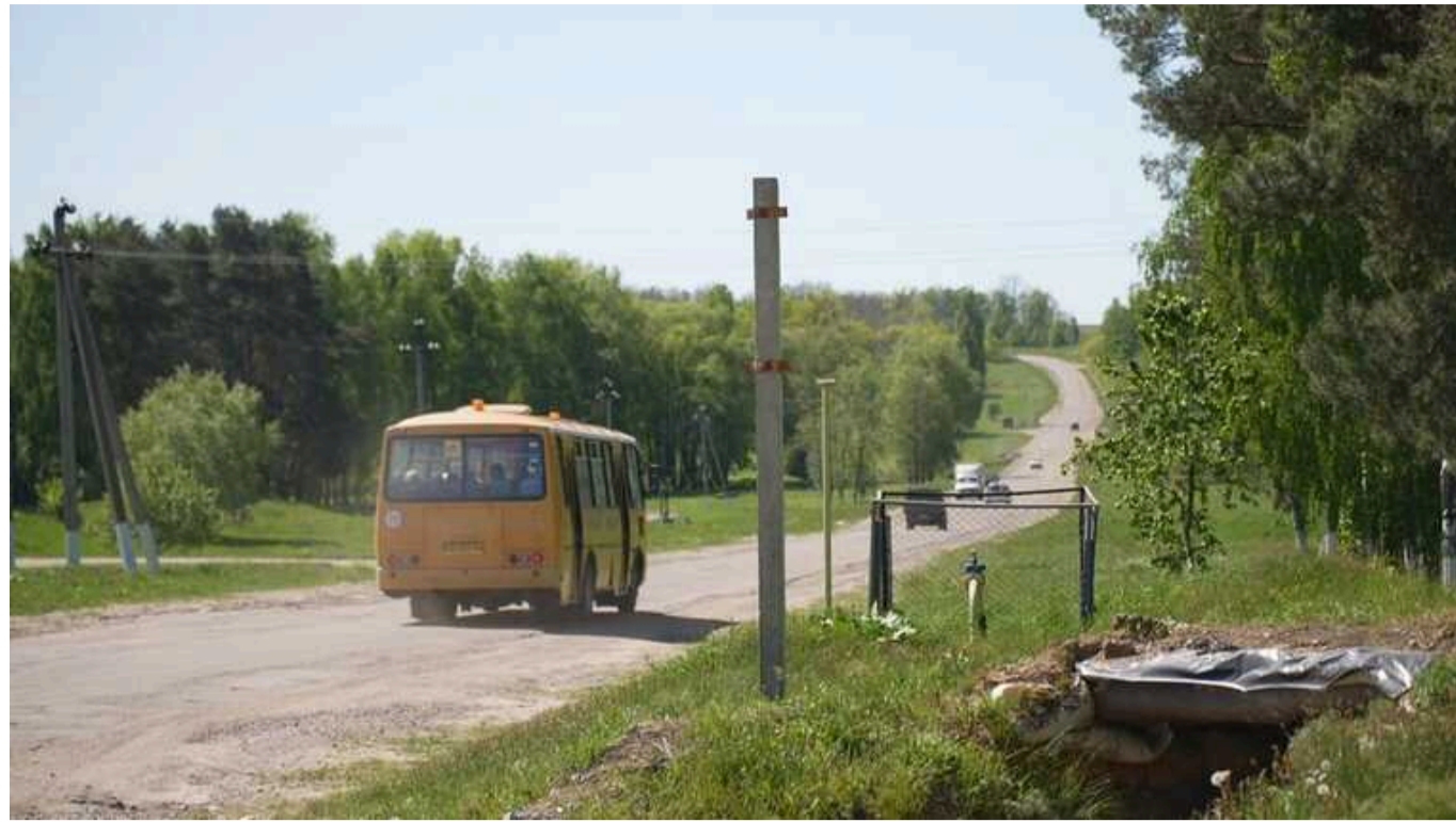
У Сумській області ОВА оголосила обов'язкову евакуацію з 23 населених пунктів

Йдеться про 10-кілометрову прикордонну територію.