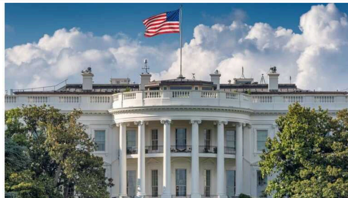
Штати попередили Туреччину про наслідки за експорт військового обладнання до РФ

США попередили Туреччину про наслідки за експорт військового обладнання в Росію. Американська влада вимагає припинити постачання мікросхем та інших деталей, що використовуються в російській військовій техніці.