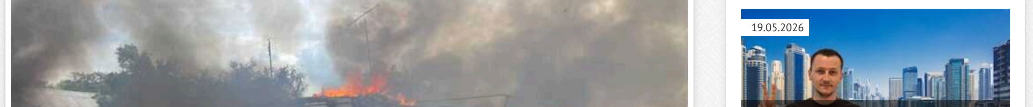
У Курській області продовжилася істерія через втрату сіл. Путін збирає Радбез

У Росію продовжується істерія через втрату контролю в цюноаційне часів російських військ приєднання в Курській області. Обстріли ведуться в центрі міста Суджа, російські війська не відступили біля до населеного пункту, жителів було майже повністю евакуйовано.