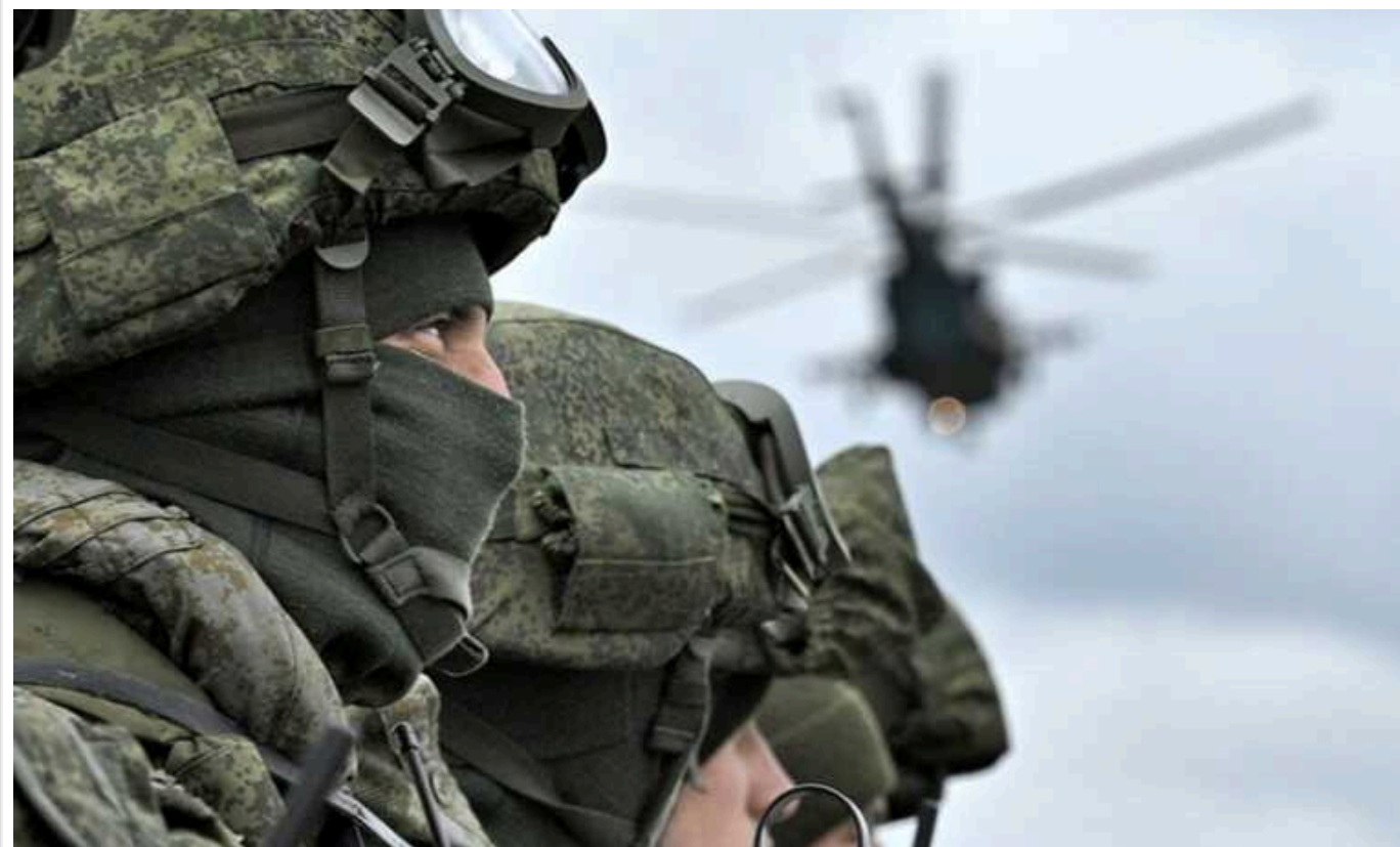
Financial Times: Окупанти досягли тактичного успіху на Донеччині, що може призвести до подальших наступів

Російські війська швидко й суттєво просунулися в Україні, скориставшись військовими недоліками та помилками Києва. Тим часом серед української громадськості зростає підтримка ідеї завершення війни шляхом переговорів. Східна Донецька область стала центром відновленого наступу Москви, що розпочався наприкінці минулого року та значно посилюється в останні тижні. Головна мета президента Володимира Путіна цього року – захопити якомога більше території.