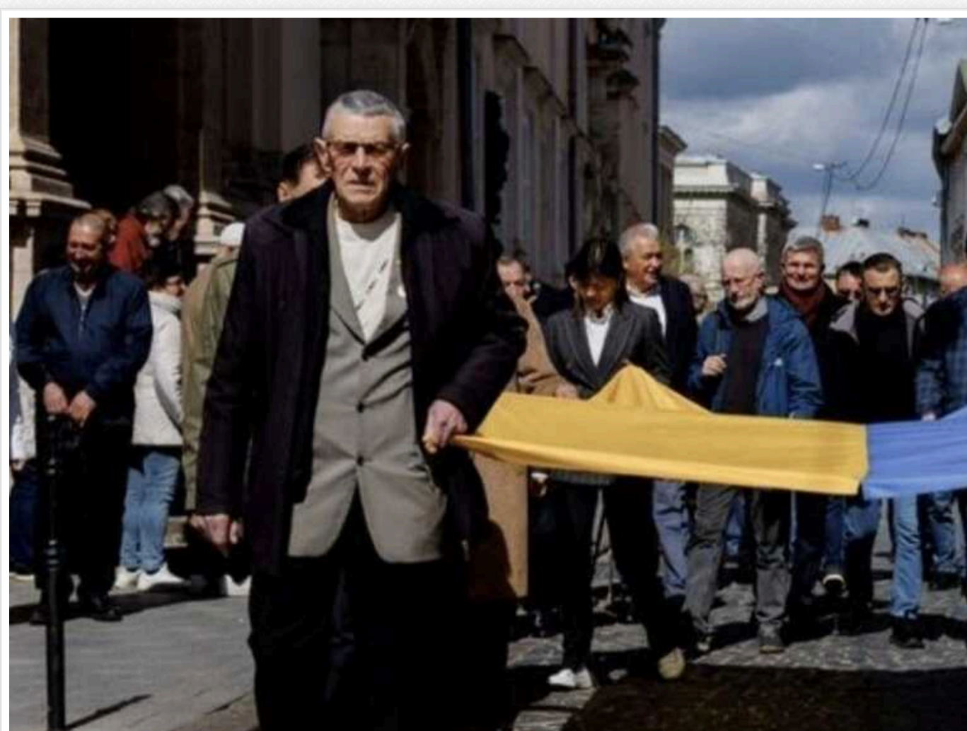
У Львові помер ексдепутат Зиновій Сяляк, який вперше підняв прапор України над Ратушею

Зиновій Сяляк був депутатом ЛМР першого демократичного скликання.