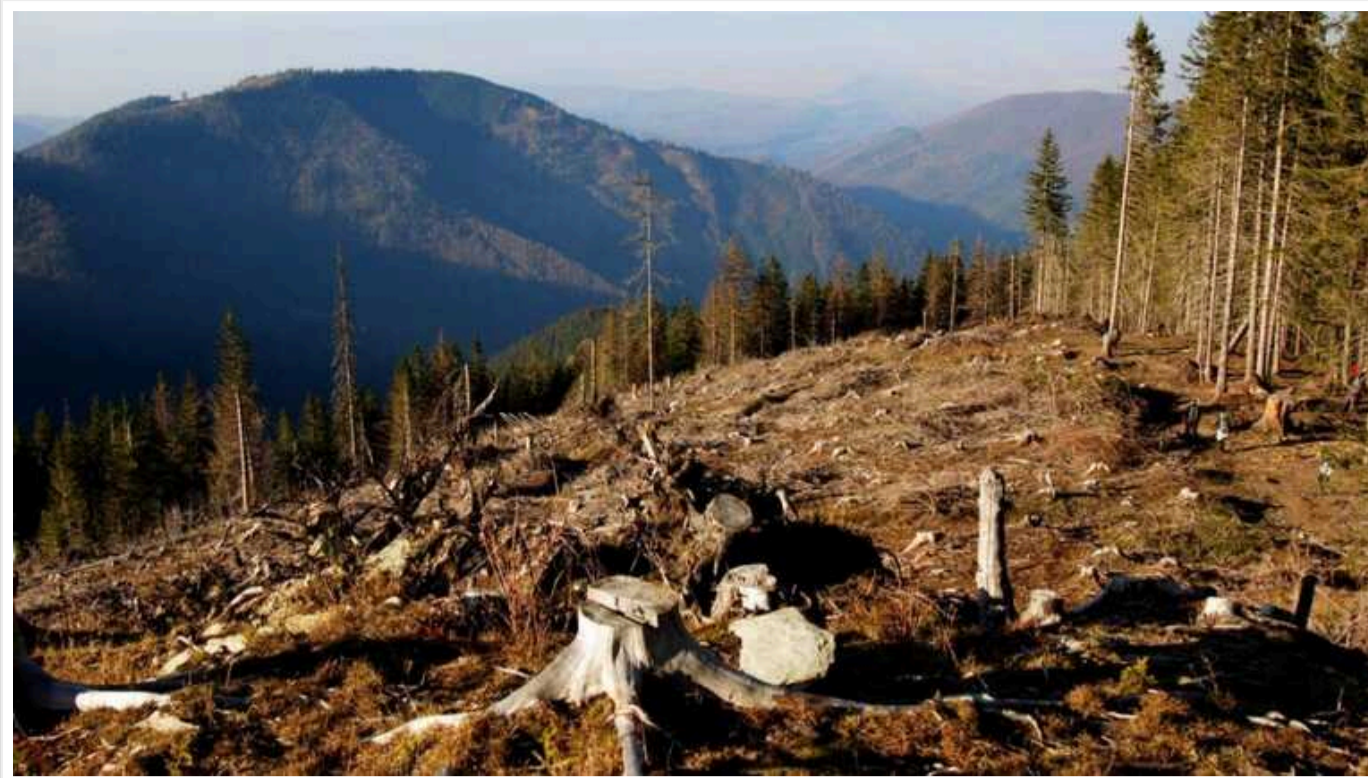
На Закарпатті посадовці ДП «Львівлісозахист» викрили на незаконних рубках на 2 мільйони гривень

Незаконно вирубали майже 300 здорових дерев.