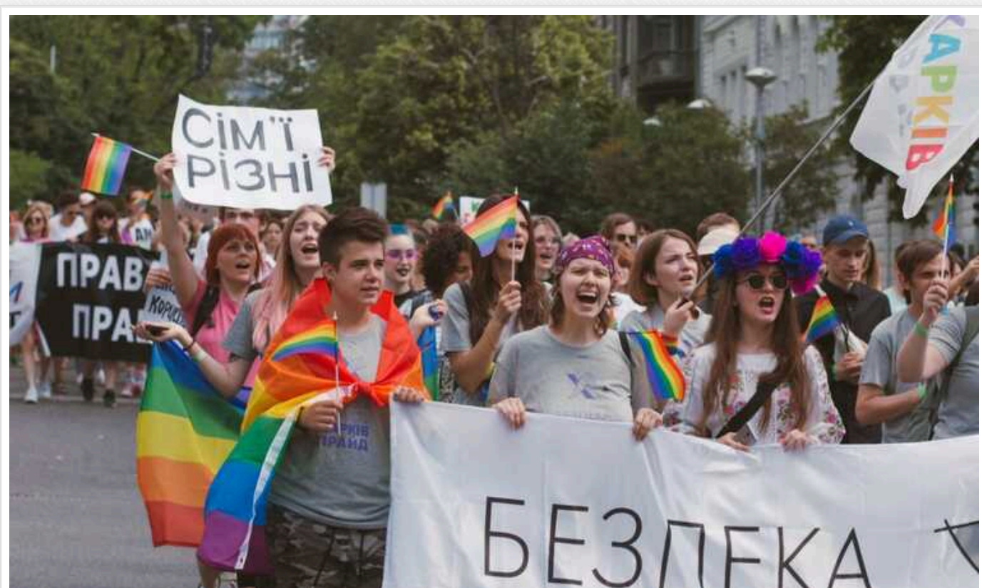
У Харкові відбудеться ЛГБТ-марш

15 вересня у Харкові відбудеться щорічний Марш рівності.