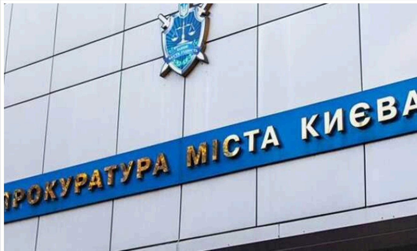
Одеситу повідомлено про підозру за підпал автівки із символікою ЗСУ в Києві

За процесуального керівництва Київської міської прокуратури 32-річному жителю Одеси повідомлено про підозру в перешкоджанні законній діяльності ЗСУ в особливий період шляхом підпалу автомобіля військовослужбовця в Дарницькому районі столиці.