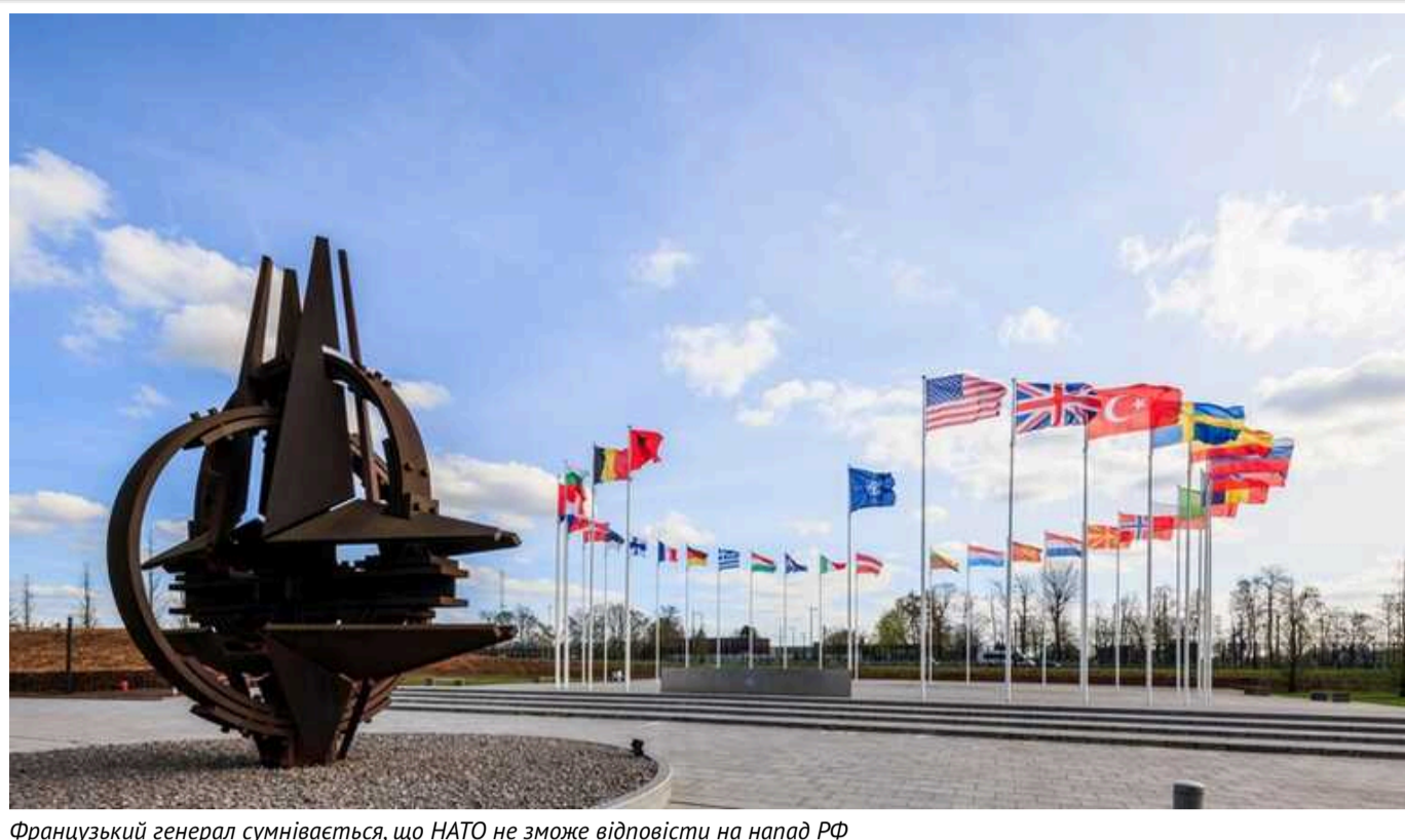
Французький генерал сумнівається, що НАТО не зможе відповісти на напад РФ

Politico пише, що у Франції вважають, що НАТО не зможе відповісти на напад Росії.